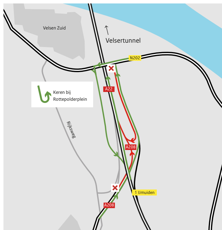
Afgesloten toerit Velsen-Zuid (N202) en Haarlem-Noord (A208): verkeer rijdt richting het zuiden en volgt de route via knooppunt Rottepolderplein richting Alkmaar.