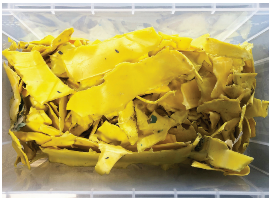
Fracties van het materiaal na decontaminatie door de Ecosteryl.