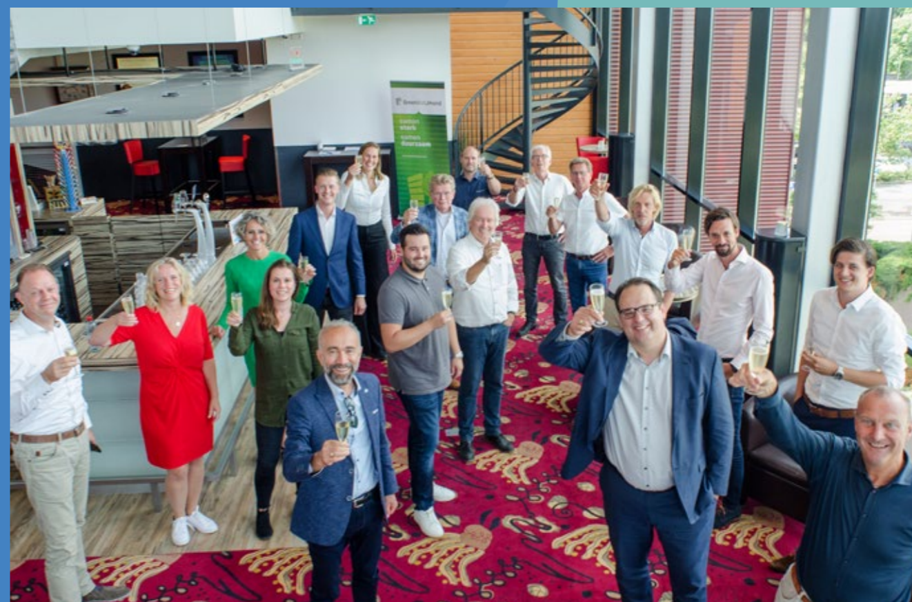
Ondertekening GreenBiz Green Deal in Beverwijk, op 2 juli 2020 in Cineworld Beverwijk.

Als het landelijke initiatief Bedrijventerreinen Energiepositief (BE+) in 2017 vraagt of GreenBiz IJmond wil aanhaken, geeft dat de vereniging een boost. De IJmondiale groep duurzame ondernemers kan de tanden in een nieuw doel zetten. Dit zorgt voor meer structuur, een nieuwe dynamiek én extra financiële middelen. Het blijkt een succesvolle opmaat naar het creëren van de belangrijke pijlers GreenBiz Educatie, GreenBiz Energy, GreenBiz Circulair, GreenBiz Assets en GreenBiz Green Deal.