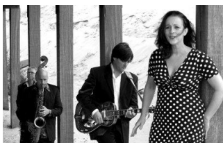
Meer informatie op de website .

De vier doorgewinterde muzikanten van Deksel pakken die klassiekers, vertalen bekende liedjes in het Nederlands en ontdoen ze van drums en elektronica. Opeens komt het half gehoorde verhaal van de liedjes haarscherp op je af. En dat levert nog weleens verrassingen op. Een muzikale innovatie!