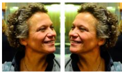
Meer informatie de website .

Van veranderen heeft ze haar vak gemaakt. Met haar stijl en energie verrast ze, geeft ze diepere inzichten en neemt ze je mee naar jouw eigen toekomst.